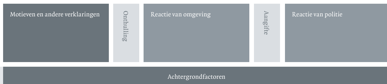
Figuur 2: Chronologie van de ontstaansgeschiedenis van onjuiste aangiften

In het model wordt vervolgens ingegaan op achtergrondfactoren (zie figuur 4) en inhoudelijke factoren die op deze momenten kunnen leiden tot drie verschillende vormen van onjuiste beschuldigingen (zie figuur 3): er is wel seksueel contact geweest tussen het vermeende slachtoffer en de beschuldigde, maar het is anders verlopen dan in de aangifte wordt verklaard (zie figuur 5); er is geen seksueel contact geweest en er is sprake van misleiding (zie figuur 6); er is geen seksueel contact geweest, maar op grond van verkeerde interpretaties is aangeefster ervan overtuigd dat het seksueel misbruik heeft plaatsgevonden (zie figuur 7).